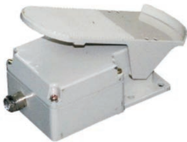
Abb. I - 3

Fußschalter doppelt, 3 m Kabel Art.Nr. 019.0.2901