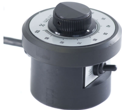
Abb. I - 5

Handfernregler 8 m Kabel Art. Nr. 013.0.1060