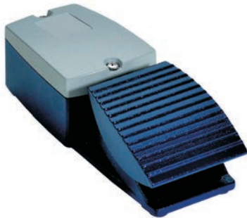
Abb. I - 1